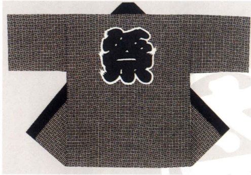
二の字小紋 生地：タッサーフロード 身丈約80cm