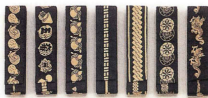
半天帯 幅5.7cm×長さ303cm 色：紺、緑、黄土色、茶、グレー 同じ帯を10本以上お誂える場合、 多少お時間がかかります。