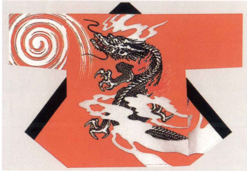
飛龍（オレンジ） 生地：タッサーフロード 身丈約80cm