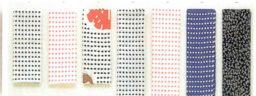
手拭い 豆しぼり：長さ85cm・105cm・85cm（祭紋入り） 青豆しぼり・松葉・まとい・かすみ・小網・ あじろ（グレー、茶）・レンガ：長さ110cm 青海波・藤：長さ100cm