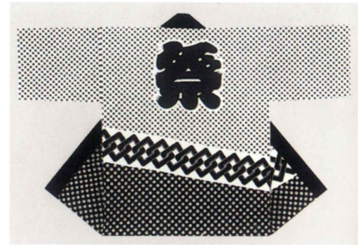
巴小紋地に斜めくるわ 生地：タッサーフロード 身丈約80cm