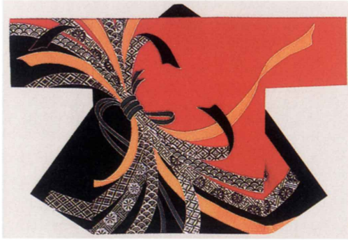
赤地に束ねのし 生地：タッサーフロード 身丈約80cm