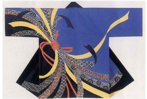
青地に束ねのし 生地：タッサーフロード 身丈約80cm