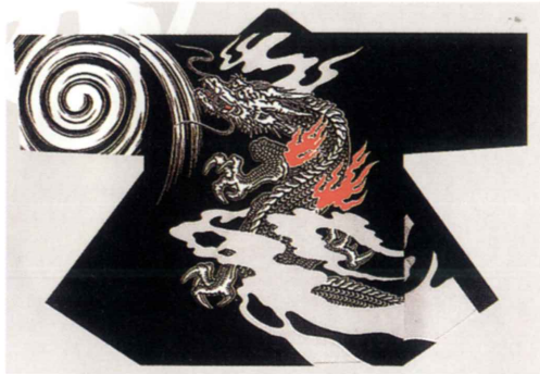
飛龍（黒） 生地：タッサーフロード 身丈約80cm