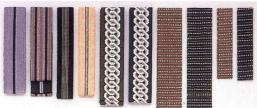
半天帯 幅5cm×長さ98cm（子供用） 幅5.3cm×長さ240cm 幅7cm×長さ235cm・240cm 幅5.7cm×長さ240cm 幅8cm×長さ138cm・260cm 幅8.5cm×長さ413cm