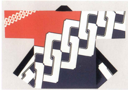
大くるわつなぎ 生地：タッサーフロード 身丈約80cm