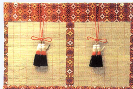
御翠簾 (細割竹新大和錦縁) 注文制作

芸能太鼓用 (化粧幟) 長さ215cm×幅69cm (一対) ポール: 全長3mスライド式 横棒85cm