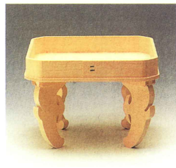
雲脚 (うんきやく) 三宝 (檜製) 21cm (7寸) ・ 24cm (8寸) 27cm (9寸) ・ 30cm (1尺)