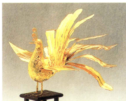
大鳥 (紙鳳凰) ●羽根幅45cm・樽神輿に最適です。

鈴紐 30cm (1 尺) ・ 39cm (1.3尺) ・ 45cm (1.5尺) ・ 75cm (2.5尺) ・ 90cm (3尺) ・ 120cm (4尺) ・ 150cm (5尺) ・ 180cm (6尺) ・ 210cm (7尺) ・ 240cm (8尺) ・ 270cm (9尺)