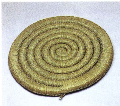
円座 直径57cm (1.9尺)