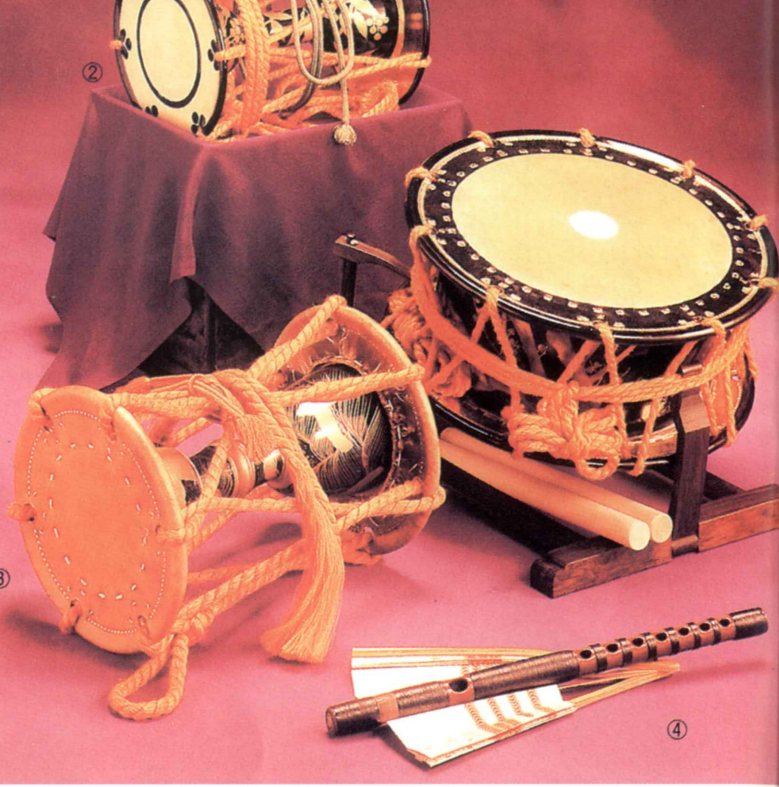
①和太鼓 (普通品) ②小鼓 ③大鼓 ④能管