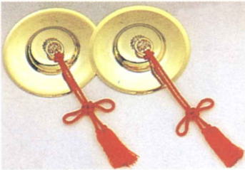
手拍子 (ちゃば) 直径 12cm (4寸) 15cm (5寸) 18cm (6寸)