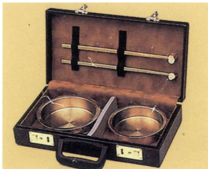
当り鉦ハードケース